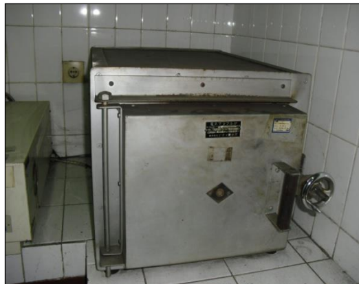
Gambar 3.3 Oven listrik